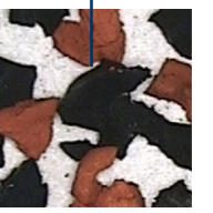
Caoutchouc / Rubber