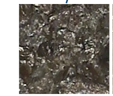
Sable / Sand

Faible densité = 3x plus de produit à utiliser que le produit Premium Low density = 3x more product to use than the Premium product