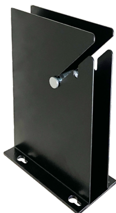
61625-67 : Distributeur Simple