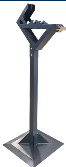
61624-67 : Distributeur Double

Lame de remplacement pour distributeur double 61626-67 disponible